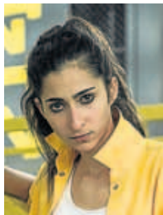
Alba Flores.

El sentimiento del honor, por eso es tan fiel a Zulema. También soy rebelde como ella, pero nada violenta.